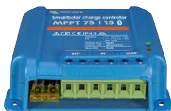
SmartSolar Lade-Regler MPPT 75/15