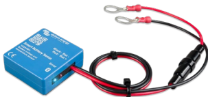
Bluetooth-Erkennung Smart Battery Sense