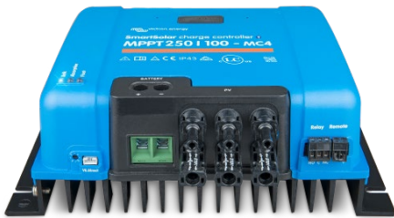
SmartSolar-Laderegler MPPT 250/100-MC4 ohne Display