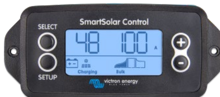
Einsteckbares SmartSolar display

Entfernen Sie einfach die Gummidichtung, die den Stecker an der Vorderseite des Reglers schützt und stecken Sie das Display ein.