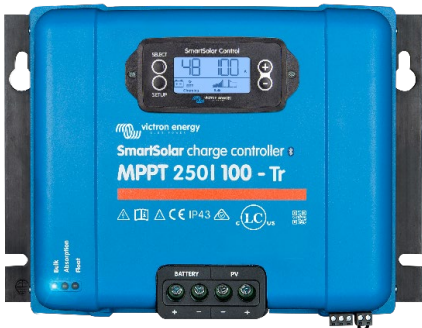
SmartSolar-Laderegler MPPT 250/100-Tr mit optionalem einsteckbarem Display