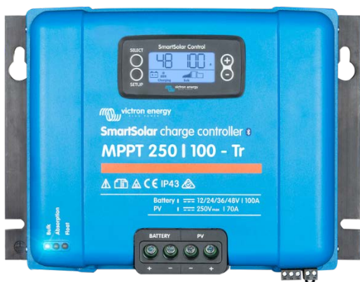
SmartSolar-Laderegler MPPT 250/100-Tr mit einsteckbarem Display

Gleicht Konstant- und Ladeerhaltungsspannungen nach Temperatur aus.