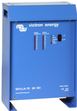
Skylla-Ladegerät 24 V 50 A