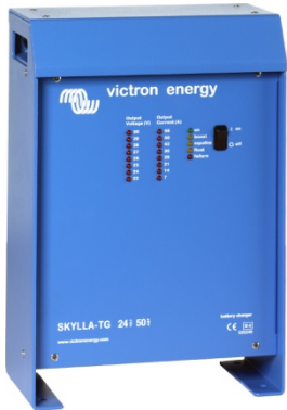
Skylla-Ladegerät 24 V 50 A