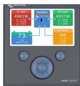
Color Control Panel, zeigt eine PV-Anwendung