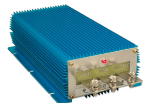
Orion IP67 24/12-100 Orion IP67 12/24-50