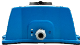
EV Charging Station - Rückseite