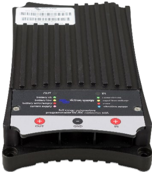
OUT LED Anzeige IN LED Anzeige