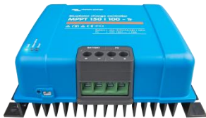
Solar-Laderegler MPPT 150/70-Tr