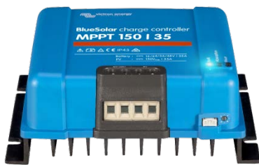
Solar Lade-Regler MPPT 150/35