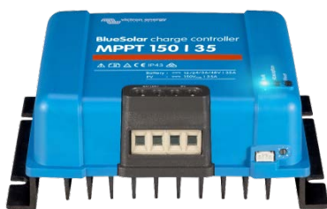
Solar Lade-Regler MPPT 150/35