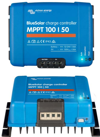
Solar Lade-Regler MPPT 100/50