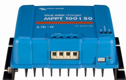
Solar Lade-Regler MPPT 100/50