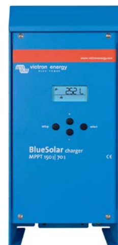
150/70 & 150/85 CAN-bus