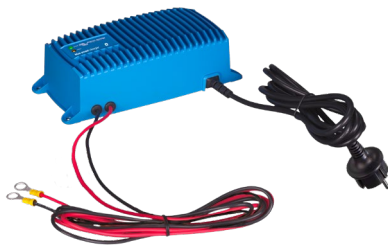
Blue Smart IP67 Ladegerät 12/25