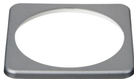
Quadratische Blende für den BMV