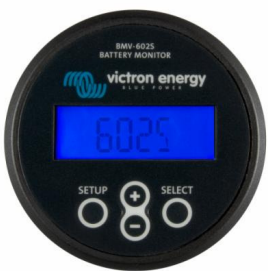
BMV 602S Black